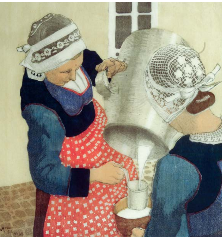
Moser Carl , Bretonische Milchverkäuferin | Venditrice di latte bretone , 1956, Farbholzschnitt auf Papier | Xilografia a colori su carta