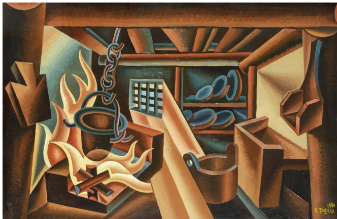
Depero Fortunato , Die Polenta auf schwerem Feuer | La polenta a fuoco duro , 1950, Öl auf Sperrholz | Olio su compensato