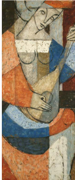
Gschwendt Heiner, Laute | Liuto , 1959, Öl und Tempera auf Holz | Olio e tempera su tavola

L'ARTE A REGOLA D'ARTE è un progetto espositivo che nasce dalla collaborazione tra la Regione Autonoma Trentino-Alto Adige/Südtirol – Assessorato al Patrimonio di Waltraud Deeg e il Museo Civico di Chiusa, un progetto di Sviluppo di Comunità chiamato La Regione fuori dai vetri . È una mostra diffusa che parte da Porta Bressanone attraversa il centro storico stando in ventuno pubblici esercizi in continuità con il progetto ARTE NEL CENTRO STORICO, per fermarsi al Museo Civico. Questo evento si realizza grazie alla forza della co-progettazione tra pubblico e privato. Vengono mostrate nelle vetrine e nel Museo ben 92 opere tra le più prestigiose dell'importante patrimonio artistico della Regione, da Depero a Dallabrida, da Bergman a Vallazza, da Eccel a Moroder-Lusenbergl.